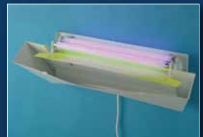
Öffnung an der vorderen Seite